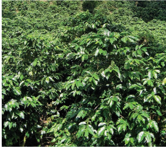
Ejemplo de un cafeto con alto vigor productivo.

Para saber el porcentaje de cafetos productivos revise 100 plantas de café por cada hectárea caminando en zig-zag en toda el área. Si usted tiene más de 65 plantas igual o parecida a la foto ya sabe que tiene un cafetal preparado para buena producción.